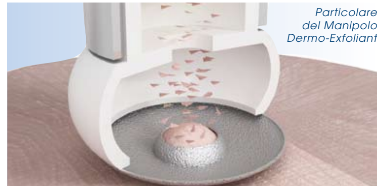
Particolare del Manipolo Dermo-Exfoliant

Questo esclusivo trattamento sfrutta l'efficacia del massaggio miodermico per ridurre visibilmente gli inestetismi cutanei da senescenza, attenuare l'affaticamento dei tessuti e rilassare le micro tensioni che causano le spiacevoli rughe d'espressione. Il metodo agisce su più livelli (linfatico, epidermico, muscolare e cosmetico) svolgendo un'azione importante sulla fisionomia del viso. Le stimolazioni che sviluppa sono piacevoli e rilassanti e si trasmettono attraverso microcorrenti modulate appositamente per l'uso estetico antietà.