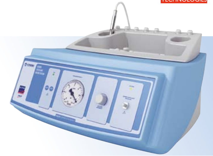
MAJOR DERMO-EXFOLIANT (art.2098/N) Micro-Dermo Abrasione Cosmetica

Dermo-Exfoliant evolve la micro-dermo abrasione cosmetica valorizzandola in termini di efficacia e convenienza. Garantisce una dermo-levigatura cutanea rapida, precisa e sicura con costi di seduta molto contenuti. Un passo avanti notevole rispetto ai passati trattamenti con sofisticate apparecchiature che sfruttavano l'azione dei cristalli di corindone, caratterizzate da costi elevati e da frequenti spese di manutenzione.