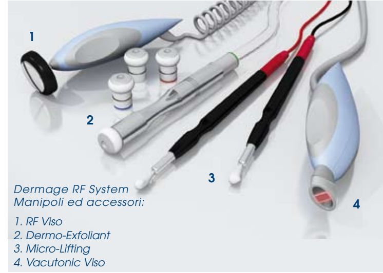
Dermage RF System Manipoli ed accessori: 1. RF Viso 2. Dermo-Exfoliant 3. Micro-Lifting 4. Vacutonic Viso

Una gradevole energia RF si trasmette in modo controllato ai tessuti. L'utente sperimenta nell'immediato una piacevole sensazione di rilassamento e di freschezza epidermica mentre sul viso si sviluppa un intenso effetto termico biologicamente attivo. L'azione che ne deriva è particolarmente performante per l'attenuazione delle pieghe cutanee e delle rughe (effetto riempitivo), per la distensione dei tratti (effetto lifting) e per la percepibile rielasticizzazione della pelle con aumento della densità, della tensione, del tono e della luminosità.